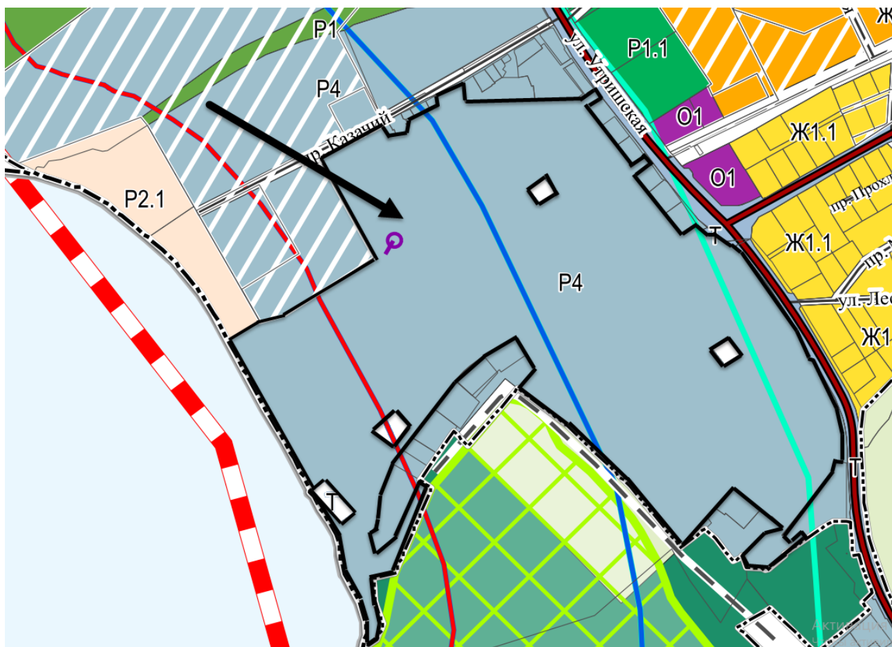
СХЕМА расположения элемента планировочной структуры

Территория «ВДЦ «Смена» в селе Сукко городского округа город-курорт Анапа Краснодарского края, составляющая территорию земельного участка с кадастровым номером 23:37:1101003:23.