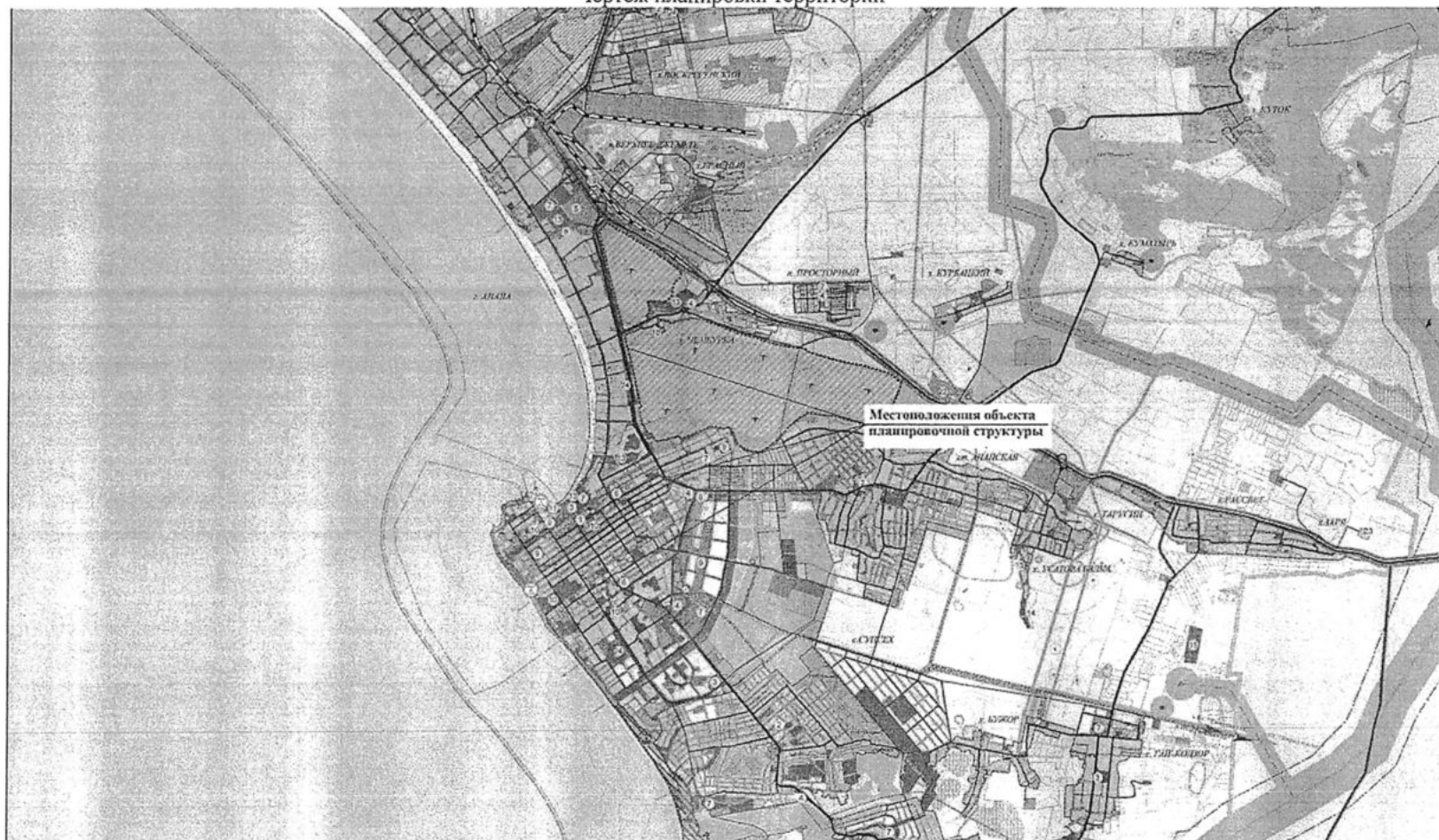
Чертеж планировки территории

Исполняющий обязанности начальника управления архитектуры и градостроительства администрации муниципального образования город-курорт Анапа