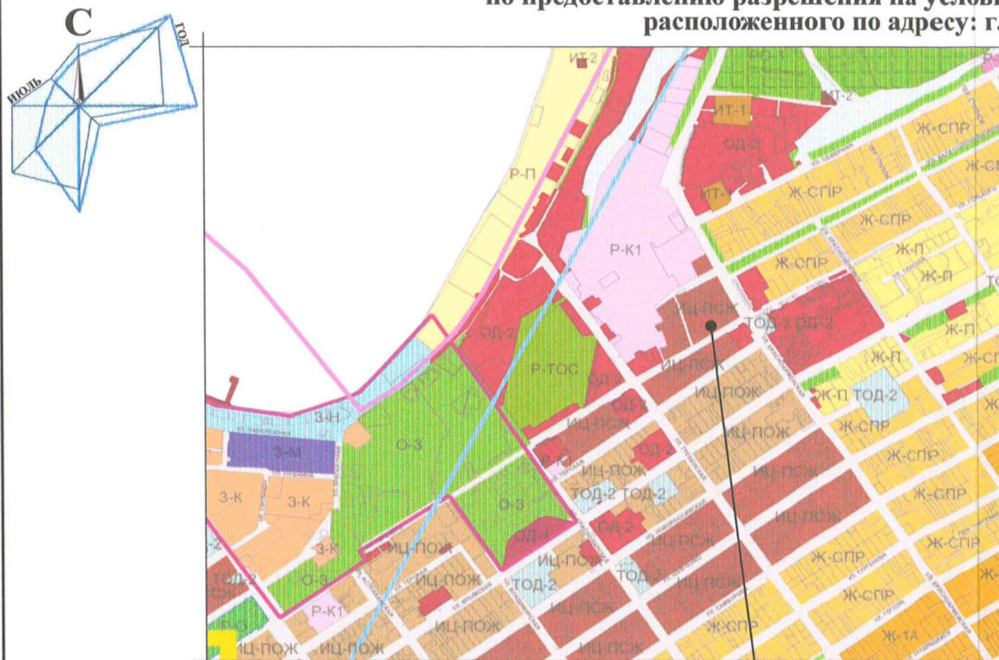
СХЕМА ПЛАНИРОВОЧНОЙ ОРГАНИЗАЦИИ ЗЕМЕЛЬНОГО УЧАСТКА. М 1:500.