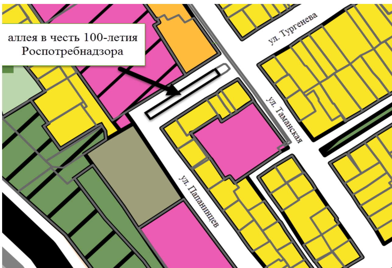
СХЕМА расположения элемента улично-дорожной сети

Аллея в честь 100-летия Роспотребнадзора в г. Анапе по ул. Тургенева, в границах улиц Таманской и Папанинцев, в кадастровом квартале 23:37:0101031.