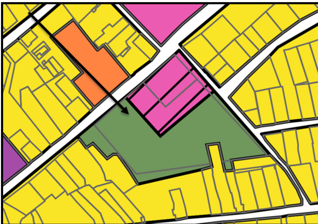
СХЕМА расположения элемента планировочной структуры

Сквер 85-летия Краснодарского края по адресу: Анапский район, село Супсех, улица Горького, 10а, составляющий территорию земельного участка с кадастровым номером 23:37:1001001:15843.