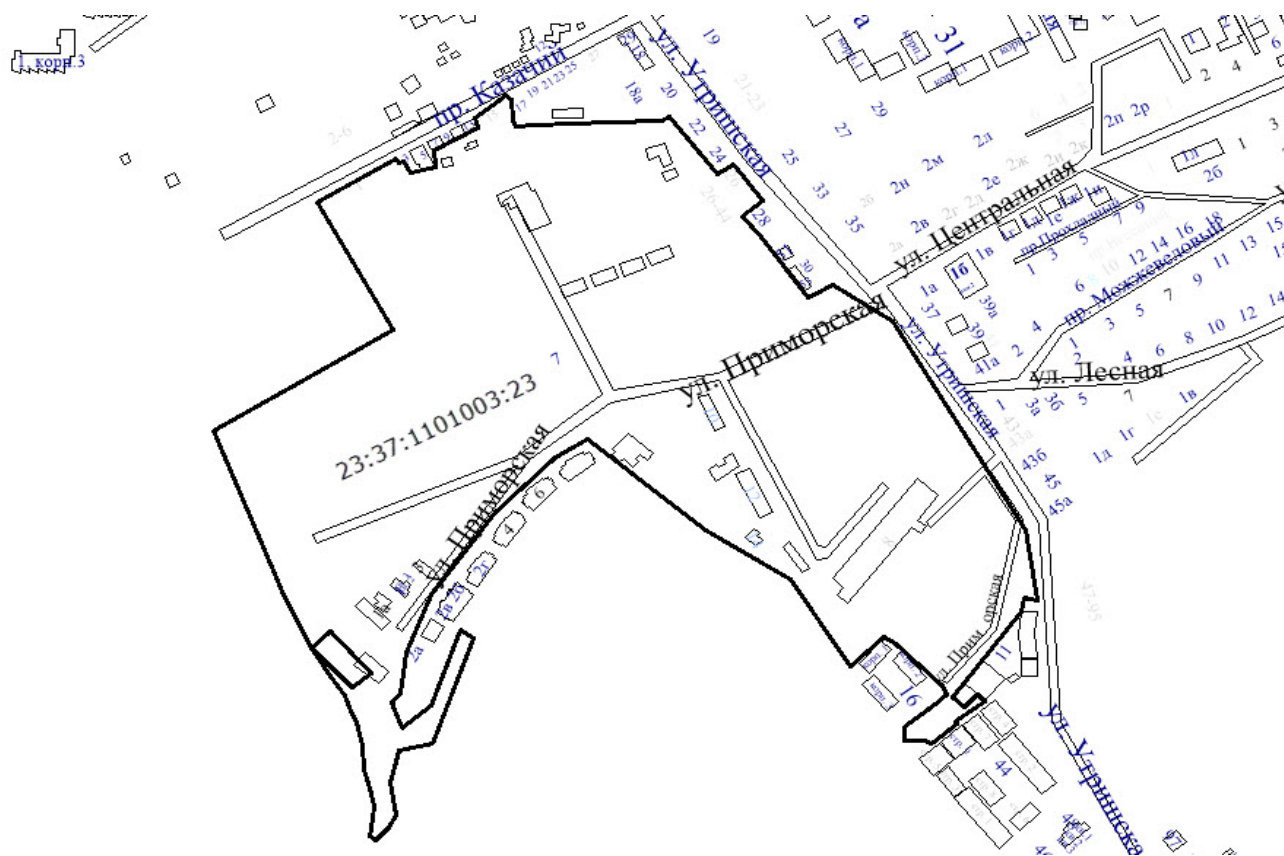
СХЕМА расположения элемента улично-дорожной сети

Улица Приморская в селе Сукко городского округа город-курорт Анапа Краснодарского края, в границах земельного участка с кадастровым номером 23:37:1101003:23, в кадастровом квартале 23:37:1101003.