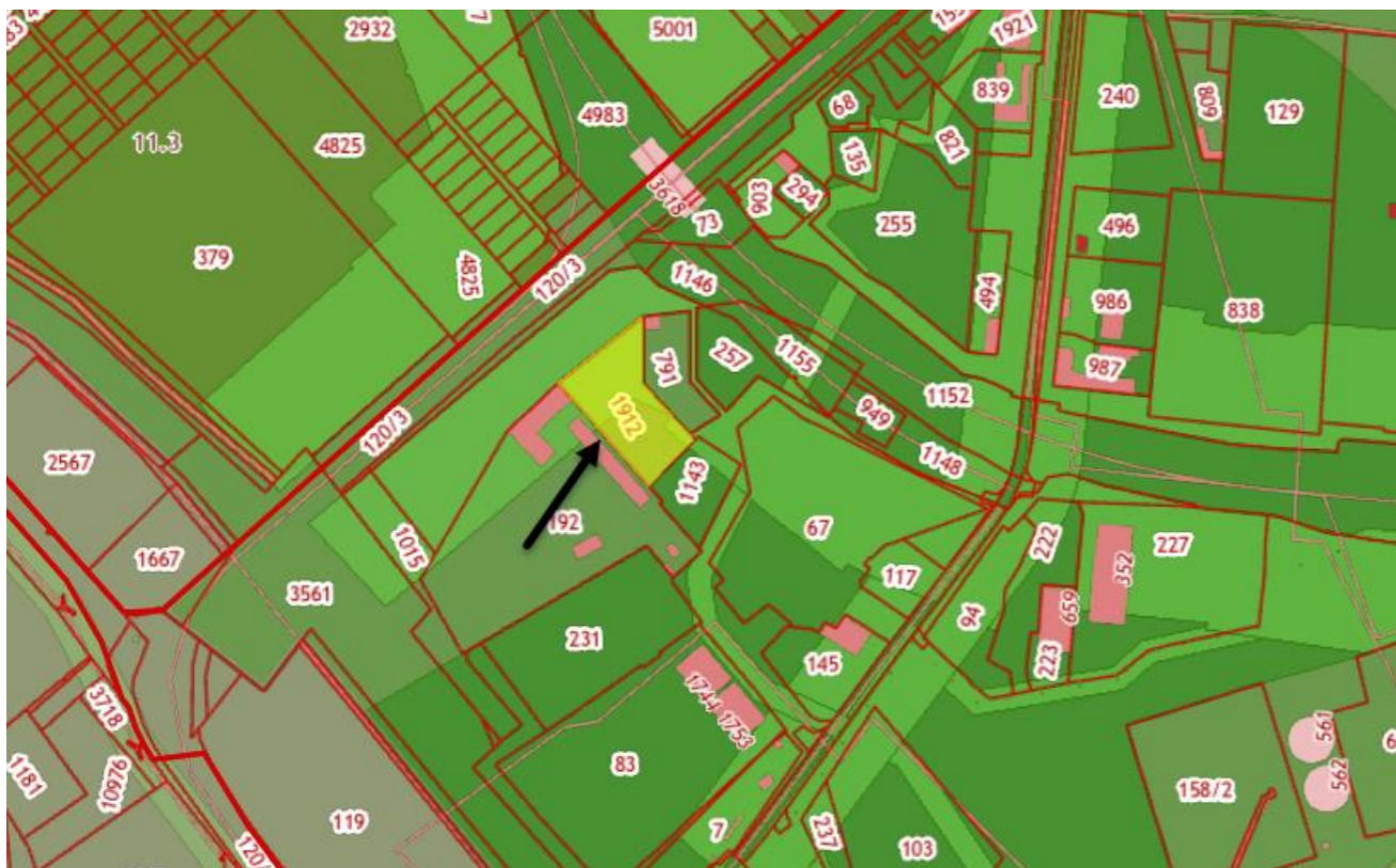
П. Производственная зона