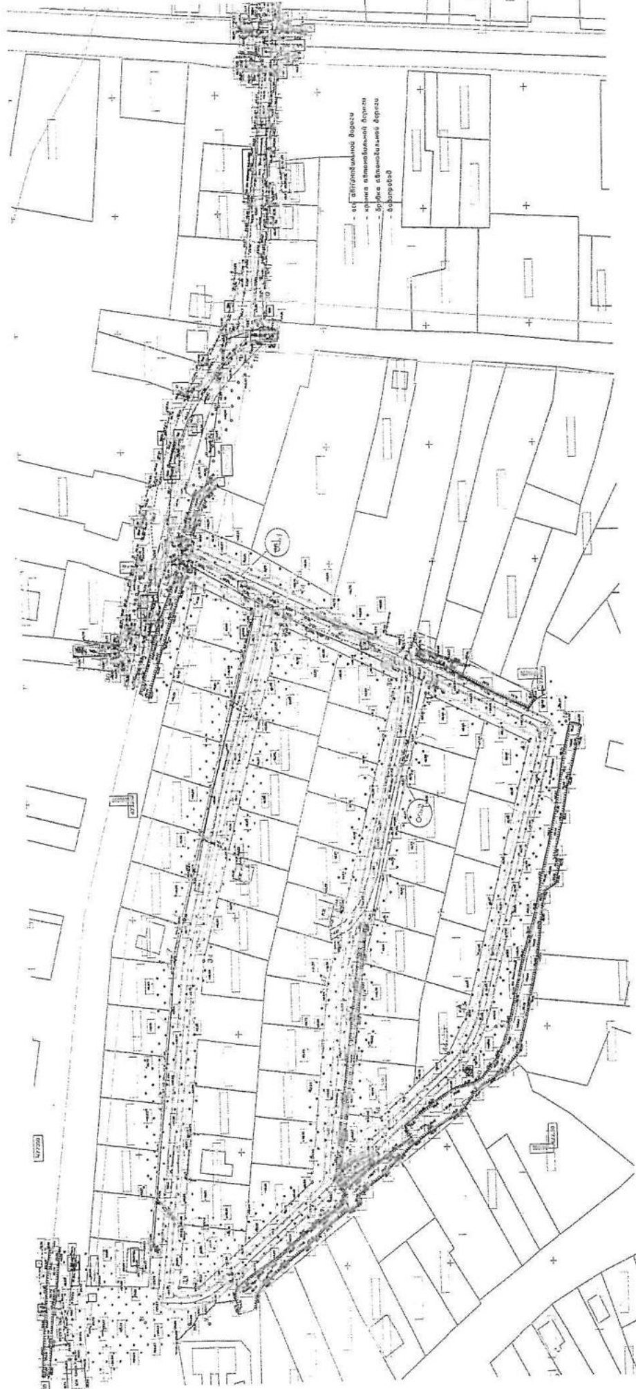
Чертеж планировки территории

Исполняющий обязанности начальника управления архитектуры и градостроительства администрации муниципального образования город-курорт Анапа – главного архитектора муниципального